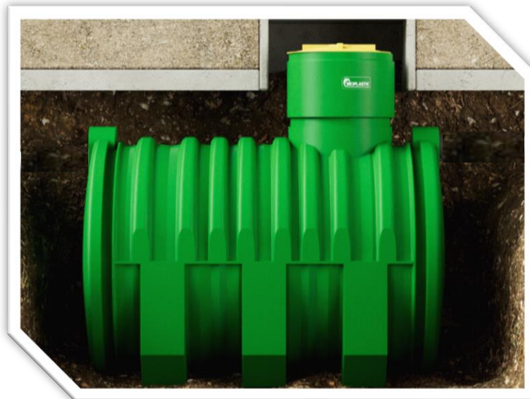
Imagen 2. Diagrama de instalación a más de 30 cm de la superficie.

Terminar el relleno con una capa de tierra para uniformar la superficie de la excavación con la del terreno natural, tomando precaución de mantener visible las escotillas de 60 cm y en caso necesario utilizar elevadores de registro.