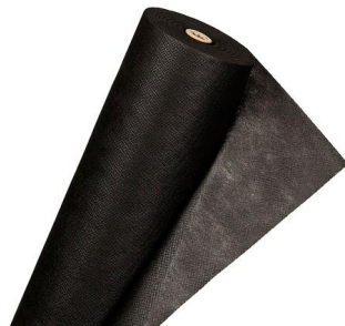
Malla Geotextil *Metros de acuerdo al kit